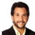
Kaya, Auteur international et chanteur.

J'ai la grande joie de faire partie de cette équipe formidable. Je peux vous assurer que pendant les webconférences, on sent vraiment l'énergie des gens. Ça va bien au-delà du virtuel.